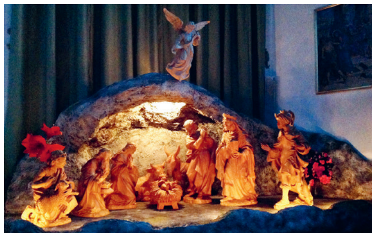
Krippe Pfarrkirche Vilters