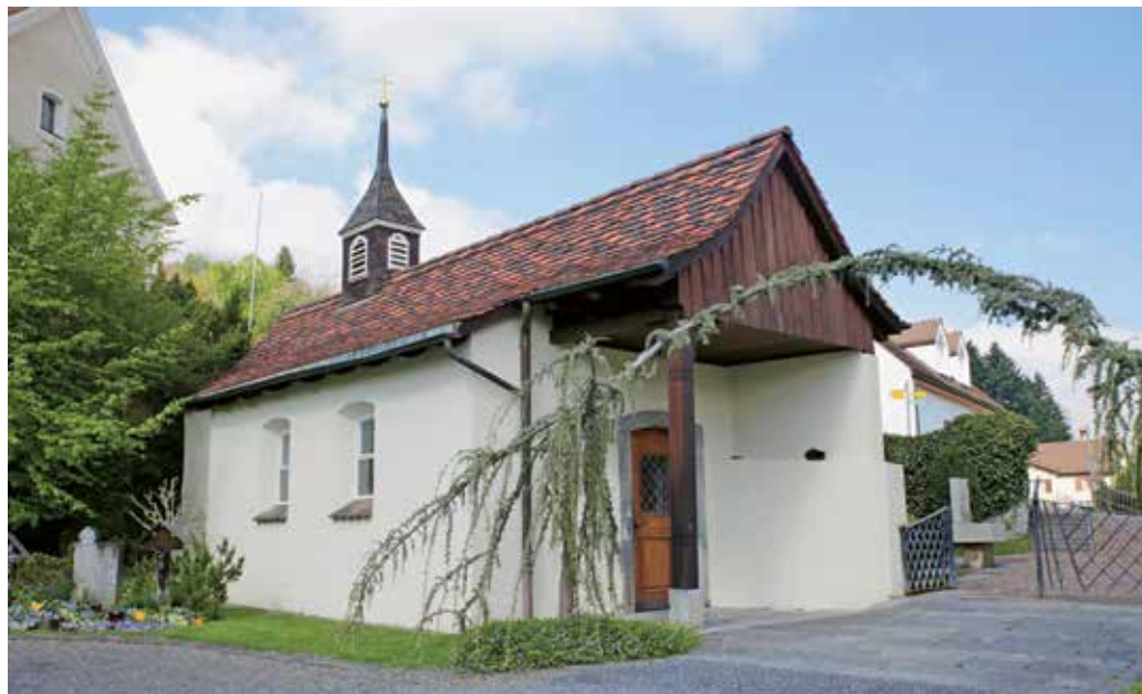
Die Friedhofkapelle in Vilters.