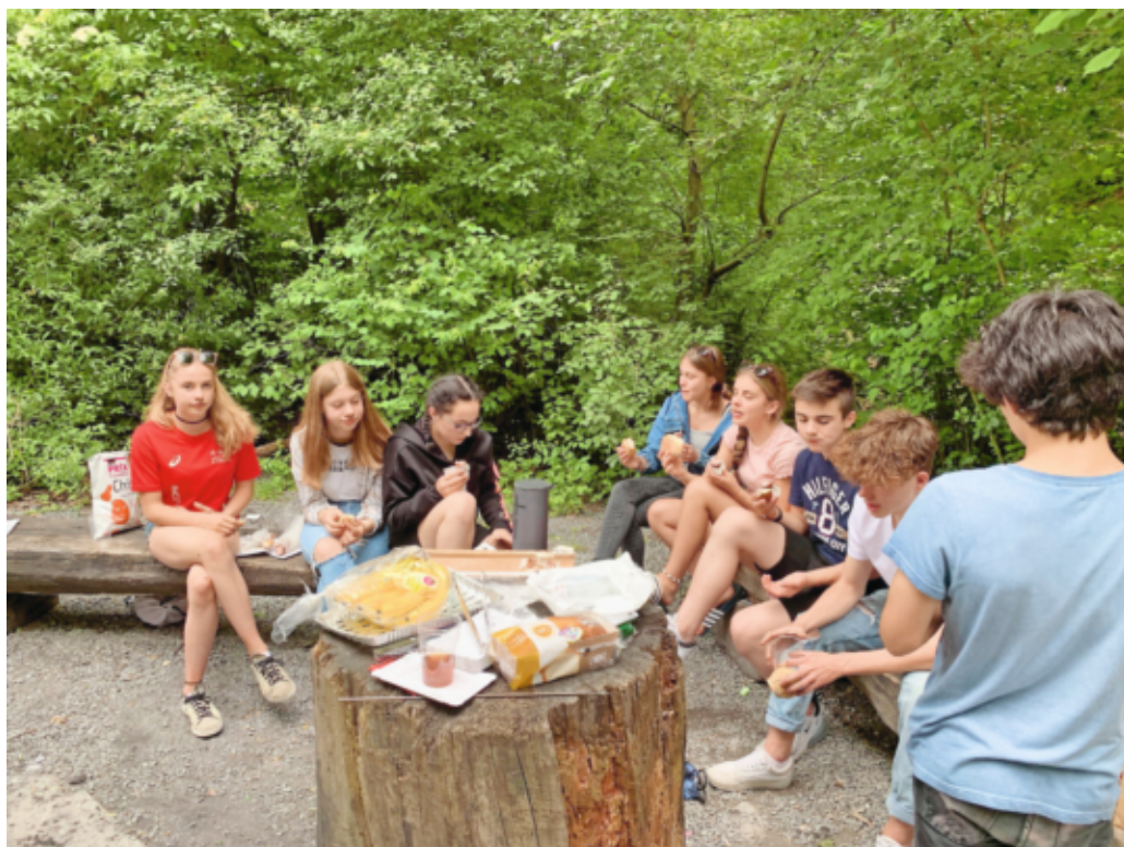
Grillplausch Jugendteam Mels

Samstag: 15.00 bis 17.00 Uhr und 20.00 bis 20.30 Uhr