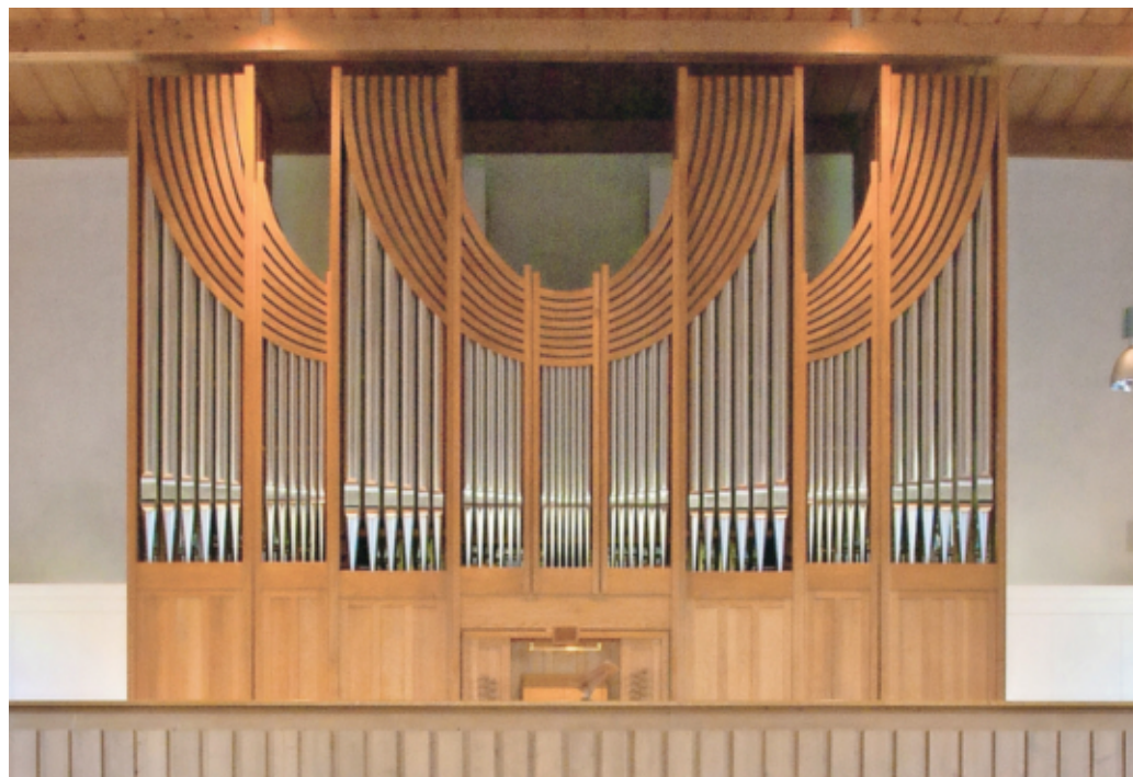
Der Orgelrevision wurde zugestimmt.