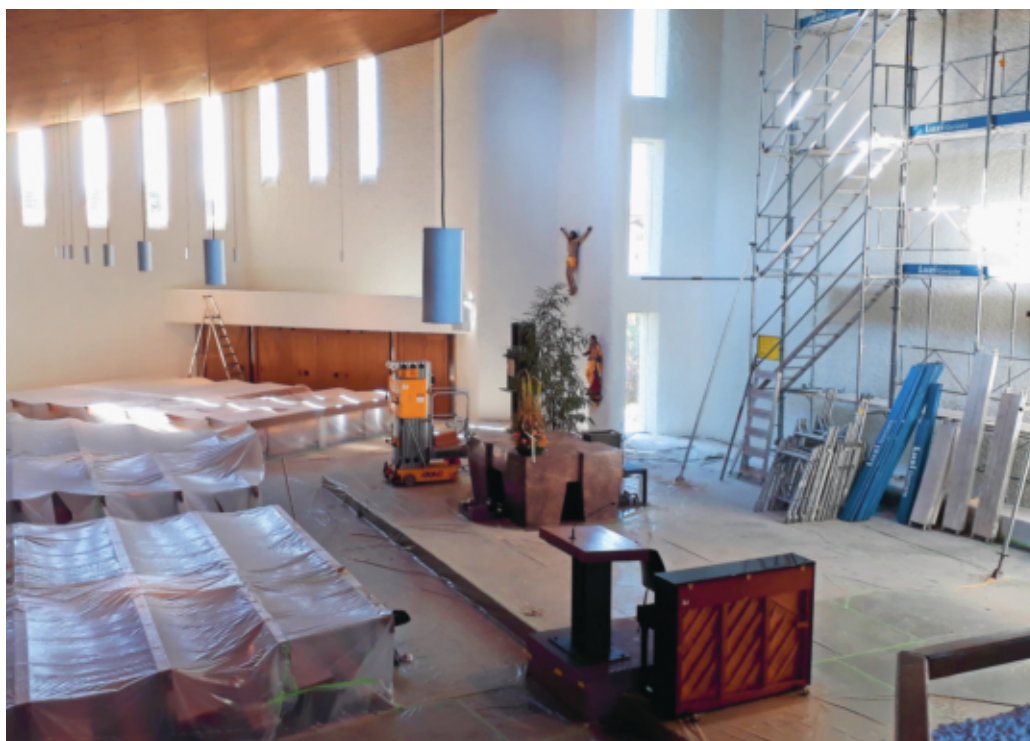
Die Pfarrkirche Heiligkreuz erscheint nach kurzer Renovation in neuem Glanz.