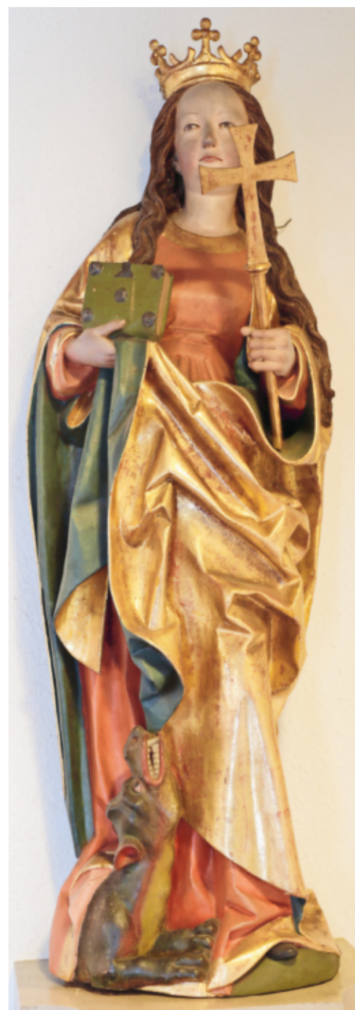
Kirchenpatronin heilige Margaretha

Die von einem nicht näher identifizierten Theotimos verfasste Leidensgeschichte der Margareta folgt dem Typus der Jungfrauen-Passiones; sie erfuhr zahlreiche lateinische und dann volkssprachliche Bearbeitungen. Margareta wurde schon bald in der Ostkirche verehrt, im Westen wurde