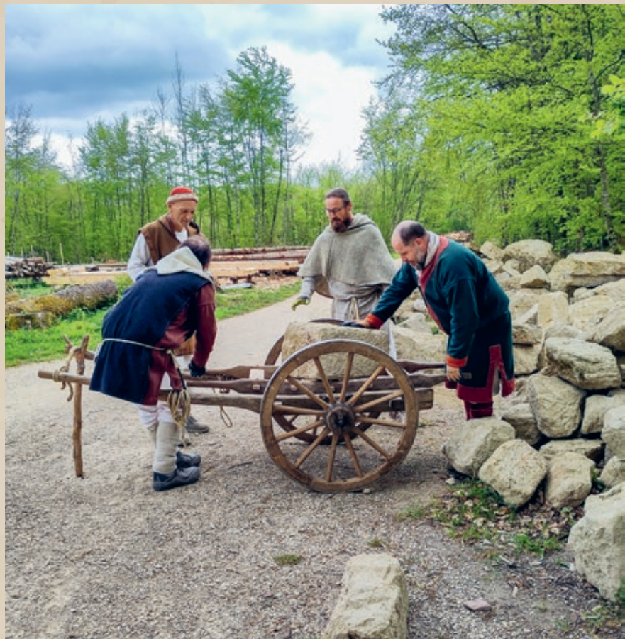
Bohrmaschinen und andere moderne Arbeitsinstrumente haben auf dem Campus Galli nichts verloren: Alles wird mit Werkzeugen und Techniken aus dem Mittelalter hergestellt. Auch Steine und andere Materialien müssen mit einem Holzwagen transportiert werden.

Zelt geschlafen, das ist auf dem Gelände auch gar nicht erlaubt.