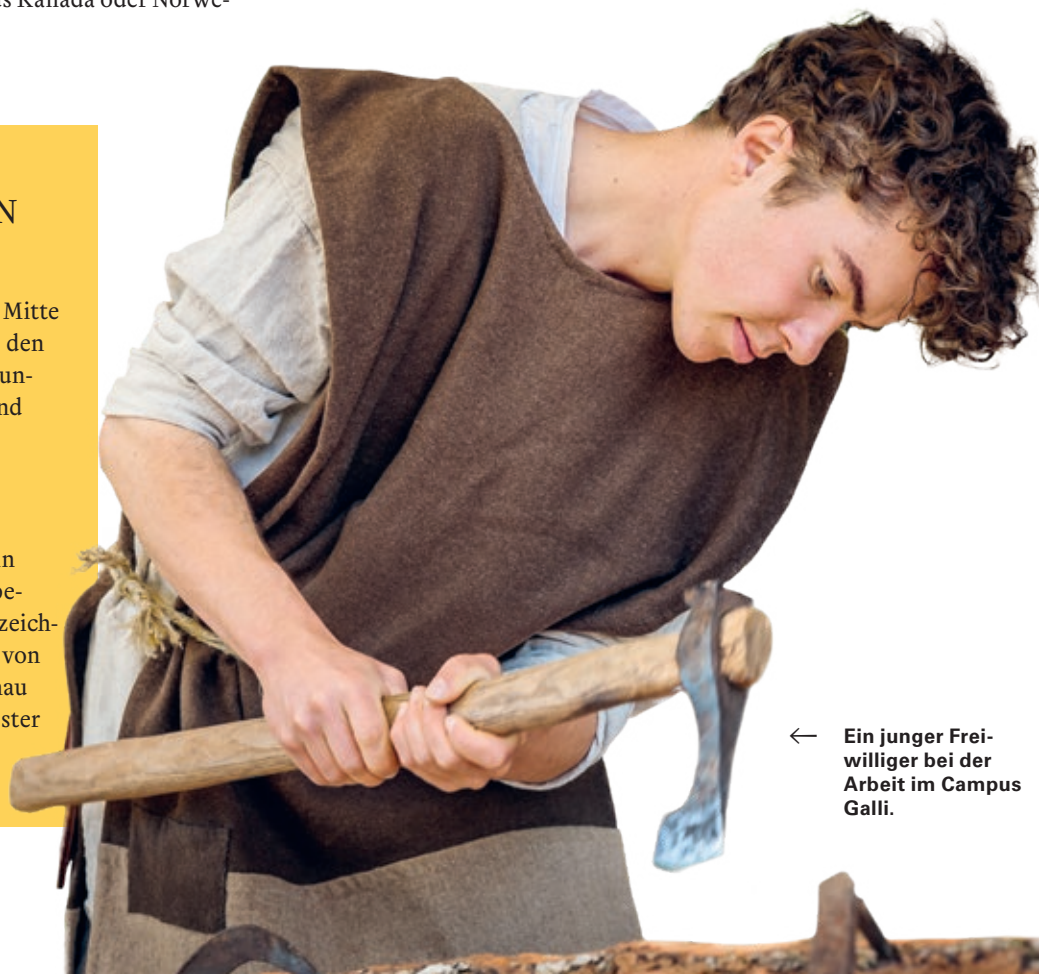
← Ein junger Freiwilliger bei der Arbeit im Campus Galli.

Der St. Galler Klosterplan gilt als einzigartig, kein anderer Bauplan ist aus dem frühen Mittelalter bekannt. Er ist die älteste überlieferte Architekturzeichnung Mitteleuropas. Gezeichnet wurde der Plan von Mönchen vor dem Jahr 830 auf der Insel Reichenau im Bodensee. Er wurde ursprünglich für das Kloster St. Gallen geschaffen, in dessen Stiftsbibliothek er bis heute liegt.