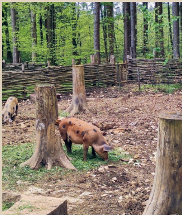
Auf dem Gelände leben auch Ziegen, Schweine und Waldschafe, eine gefährdete alte Hausschaf rasse. Auch die Landwirtschaft spielt eine wichtige Rolle: Neben zahlreichen Kräutern wachsen auf dem Gelände auch über achtzig verschiedene Arten von Blumen und Gräsern.