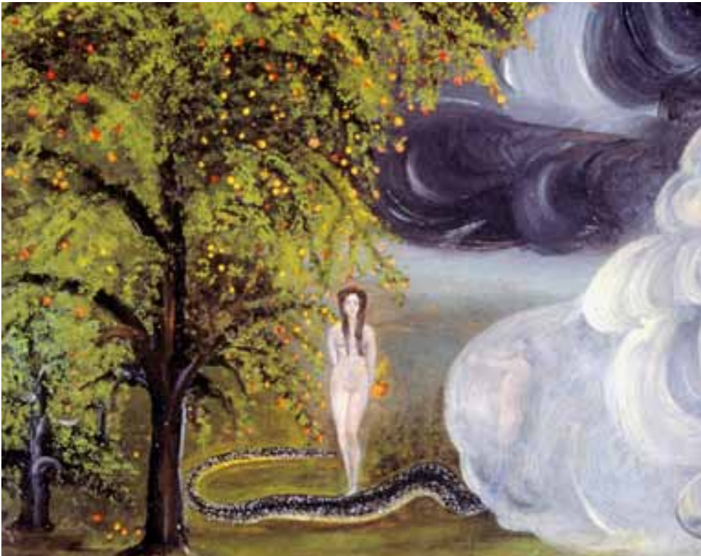
Samuele Giovanoli (1877–1941): «Evas Wolken», Museum im Lagerhaus, St.Gallen.

Immer wieder begegnet mir in meiner Arbeit in der biblischen Erwachsenenbildung die Frage: «Welche Bibel soll ich kaufen?» Da ist jemand in eine Buchhandlung gegangen und wollte einfach «eine Bibel» kaufen – und stellt dann fest, dass es eine ganze Anzahl verschiedener Ausgaben und Übersetzungen gibt.