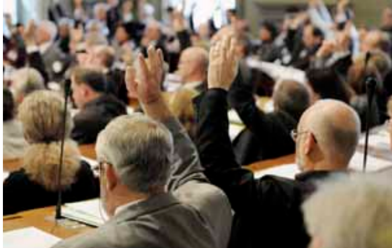
Die Kollegienräte (Kirchenparlament) stimmen über die Anträge des Administrationsrates («Regierung») ab.