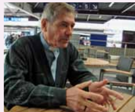
Bischof Luis Flavio Cappio

In Brasilien kämpft Luis Flavio Cappio, Franziskaner und Bischof von Barra, gegen das Ableiten von Wasser aus dem Rio São Francisco durch zwei Kanäle. Die Kritiker bemängeln, dass das Projekt Grossgrundbesitzern, den Produzenten von Agrotreibstoffen und der Industrie zugute komme – auf Kosten der armen Bevölkerung im Tal des Rio São Francisco. Weltweit bekannt wurde Dom Cappio, weil er deswegen schon zweimal in den Hungerstreik getreten ist. Bisher allerdings war der gewaltlose Widerstand erfolglos: Die Kanäle werden derzeit vom brasilianischen Militär gebaut. Kipa hat den Bischof anlässlich des Sozial- und Umweltforums in St.Gallen getroffen. Cappio ruft ausländische Gruppen auf, Druck auf die brasilianische Regierung auszuüben. Das habe mehr Gewicht als der Protest der Betroffenen. Er erinnerte an die ökumenische Wassererklärung von Schweizer und brasilianischen Kirchen, die vor fünf Jahren unterzeichnet wurde. Darin heisst es, der Zugang zu Wasser sei ein Menschenrecht. Wasser sei nicht bloss Wirtschaftsgut, sondern ein öffentliches Gut. Es habe eine soziale, kulturelle, medizinische, religiöse und mystische Bedeutung und sei Grundvoraussetzung für alles Leben. «Wir leben in einer Welt, die von einer Ideologie dominiert wird: Der Neoliberalismus sieht alles, was es gibt, als handelbares Gut», kommentiert Cappio. «Aus Sicht der Kirche gibt es noch eine höhere Ethik, die dem entgegensteht.» (Kipa/pem)