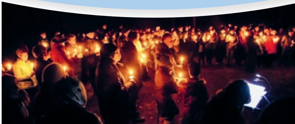
Waldweihnacht bei der Marper Forsthütte

Staatsstr. 58, 9437 Marbach Don Egidio Todeschini Tel. 00423-232 29 22 mciscaaan@gmx.net