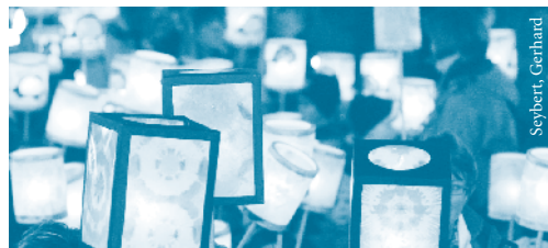
Martinsfeier für Familien