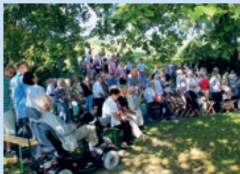
Maria Himmelfahrt bei der Forstkapelle

Fr 13.09. 18.00 Eucharistiefeier im Kloster Maria Hilf