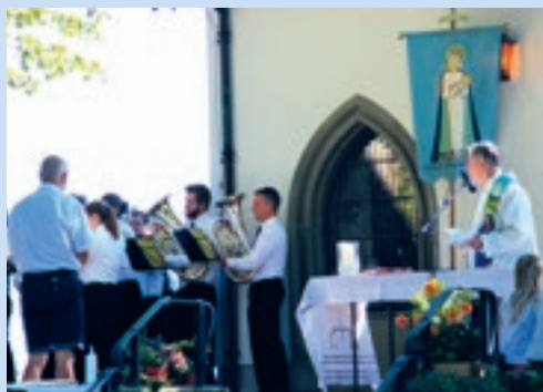
Maria Himmelfahrt bei der Forstkapelle

Fr 06.09. 17.30 Vesper, anschliessend 18.00 Eucharistiefeier im Kloster Maria Hilf