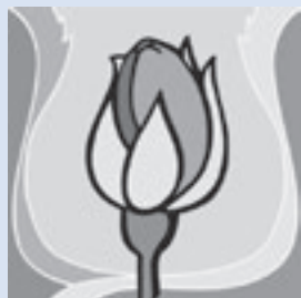
Maria Geburt – 8. September

Fr 07.09. 18.00 keine Eucharistiefeier im Kloster Maria Hilf