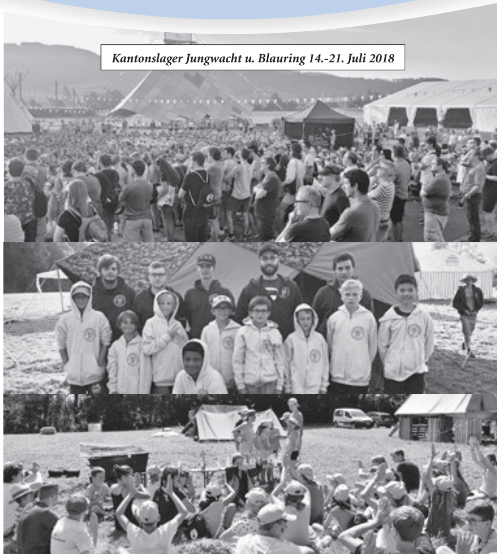
Kantonslager Jungwacht u. Blauring 14.-21. Juli 2018

Eine Woche durften unsere Kinder und Jugendlichen aus Blauring und Jungwacht mit ihren Leitern ein Kantonslager mit viel Spiel, Spannung, Spass, guter Laune und wunderbarem Wetter verbringen. Allen Leiterinnen, Leitern, Helferinnen und Helfern einen herzlichen Dank für das tolle Engagement.