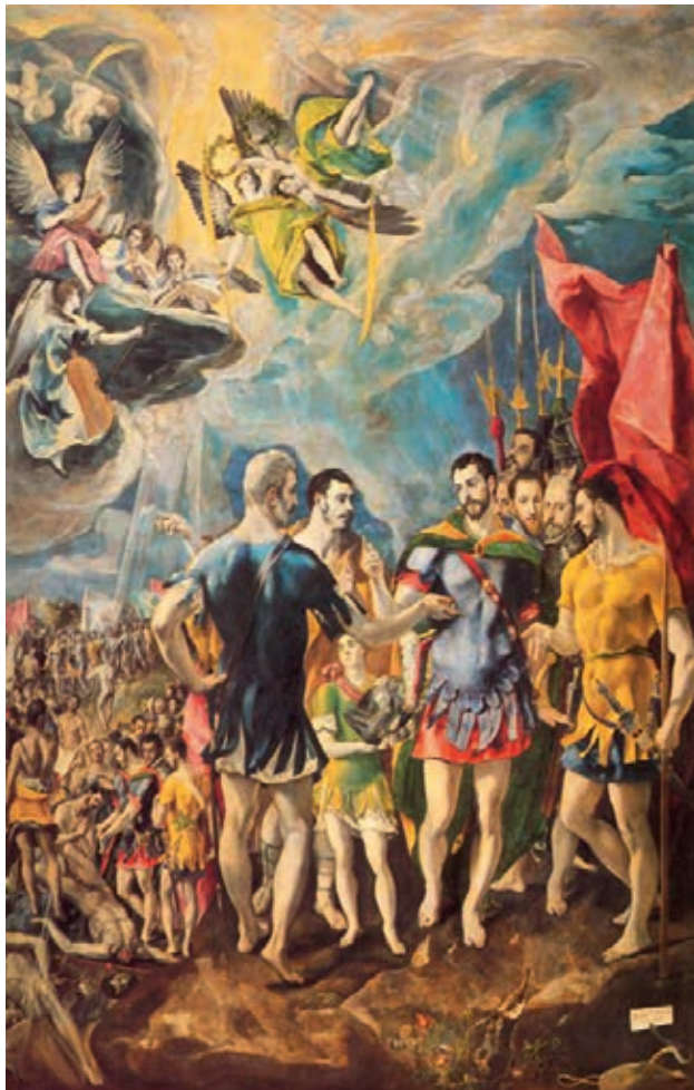
Das Martyrium von St. Maurice, 1580–1582 von El Greco