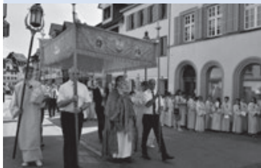
Dankprozession Fronleichnam am 3. Juni 2018

Fr 06.07. 18.00 Eucharistiefeier im Kloster Maria Hilf 19.00 Lagergottesdienst bei der Forstkapelle