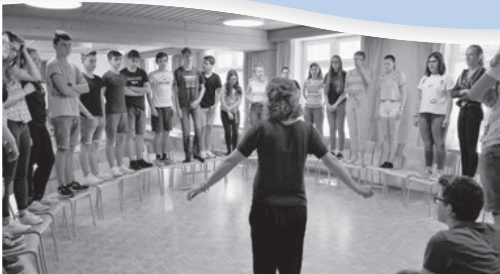
Die diesjährigen Orientierungstage der Oberstufe haben in der Burg stattgefunden. Die fachkundige Leitung aus dem Pestalozzidorf Trogen verstand es, mit interessanten Themen die Jugendlichen abzuholen und zu begeistern.