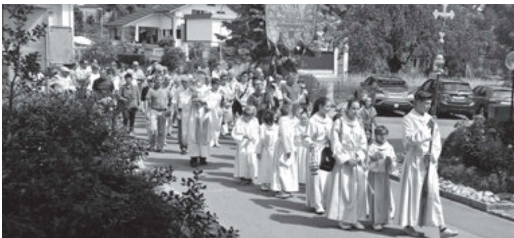
Am Sonntag, 3. Juni, hat unsere Pfarrei den Festgottesdienst zu Fronleichnam gefeiert. Die Erstkommunionkinder haben unsere Seelsorger bei der Gestaltung der Feier unterstützt. Nach dem Gottesdienst hat die Fronleichnams-Prozession zum Altersheim Geserhus stattgefunden, die vom MVR musikalisch begleitet wurde. Im Anschluss hat der Pfarrreirat einen feinen Apéro vorbereitet.