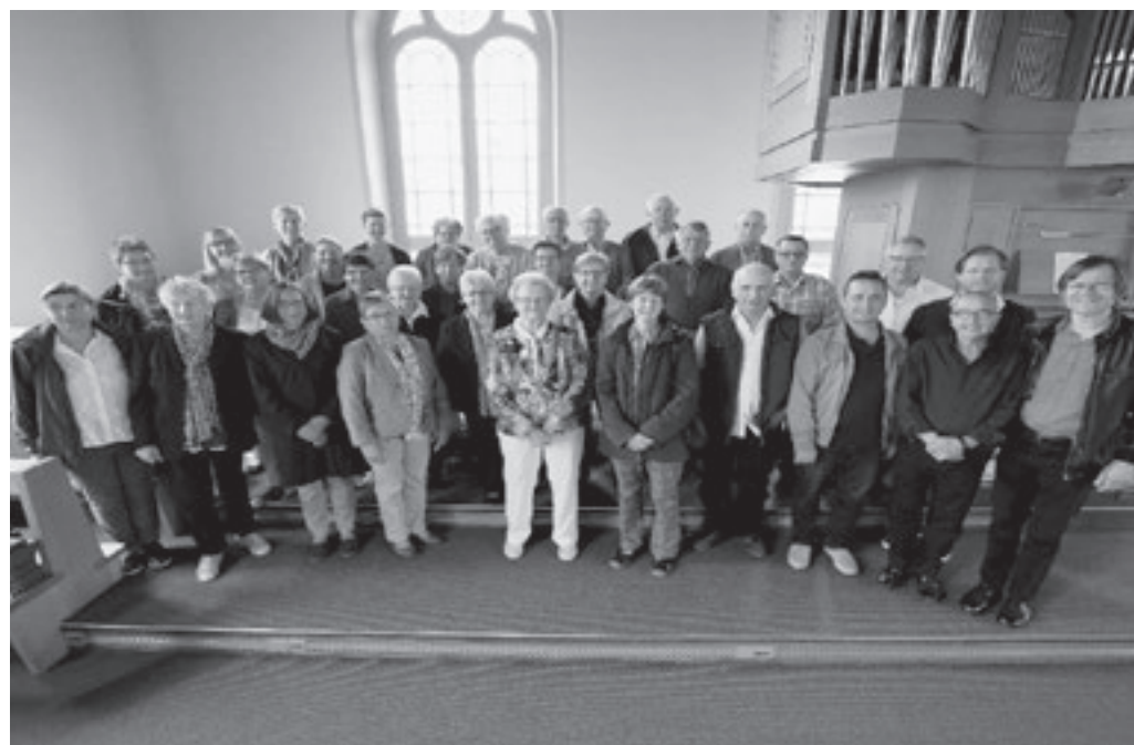
Der «verstärkte» Kirchenchor an Pfingsten. Mit dem Chorprojekt «Ich will, dass es brennt!» konnten 13 neue SängerInnen begeistert werden.

Bitte bis am 8. Juli 2018 an: kath.marbach@bluewin.ch