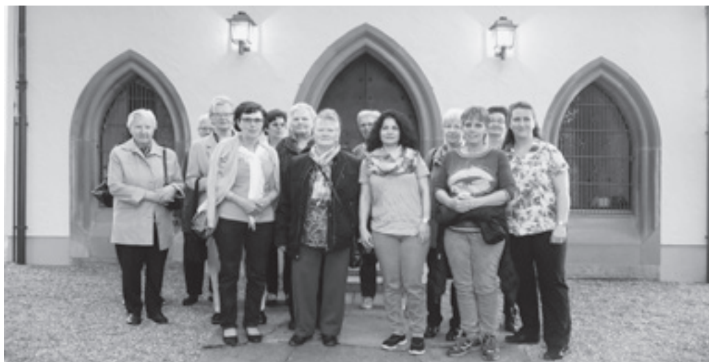
Der kath. Frauenverein unternahm seine traditionelle Maifahrt dieses Jahr am 5. Mai zur Forstkapelle in Altstätten. Nach der Maiandacht folgte geselliges Beisammensein im Restaurant Sitegass unterhalb der Altstätter Pfarrkirche.