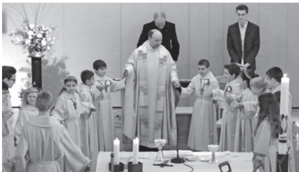
Am 12. April durften fünf Buben und vier Mädchen aus Hinterforst und Eichberg in einem feierlichen Gottesdienst zum ersten Mal Jesus in der Gestalt von Brot begegnen. Der Gottesdienst stand in diesem Jahr unter dem Motto «Der Schatz im Acker».

Wir freuen uns auch darüber, dass wiederum Jugendliche mit Töffli ebenfalls den Weg auf sich nehmen.