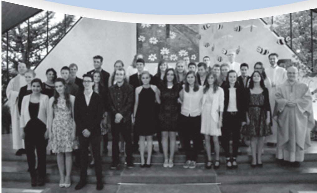
Am Samstag, 2. Mai 2015, empfangen 28 Jugendliche in Lüchingen das Sakrament der Firmung.