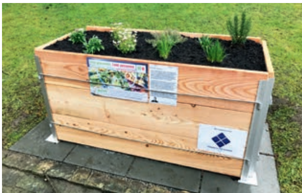
HOCHBEET bei der Kolumbanskirche

Fehlt das Land, fehlt das Brot. In der Ökumenischen Kampagne 2017 weisen Brot für alle, Fastenopfer und Partner sein auf die negativen Folgen von Land Grabbing hin. Auch Schweizer Banken und Finanzinstitute investieren in Projekte, die Monokulturen fördern. Land muss dem Leben dienen und nicht dem Profit, lautet die zentrale Aussage der Ökumenischen Kampagne 2017. Weltweit haben sich Investoren bis heute – konservativ geschätzt – 47,7 Millionen Hektar Land angeeignet, das bislang von der lokalen Bevölkerung genutzt wurde. Dies entspricht 12 Mal der Fläche der Schweiz.