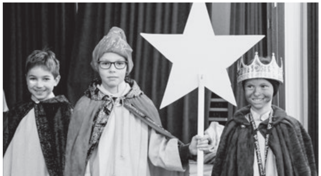
An vier Tagen sind Sternsinger durch unsere Pfarrei gezogen. Die Schüler sammelten Fr. 5389.– für Kinderprojekte von MISSIO. Ein herzliches Dankeschön gilt allen Spendern!