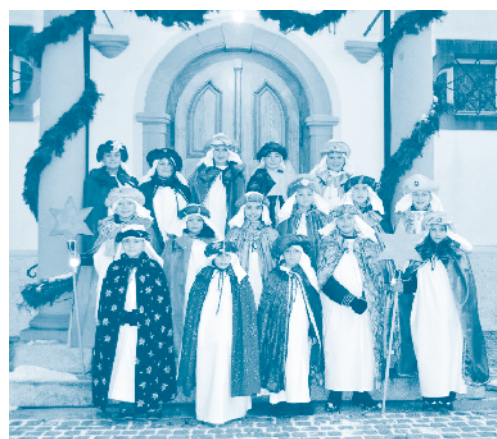
Die Sternsinger waren in unserem Dorf unterwegs...