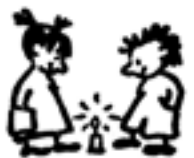
Fiire mit de Chliine

Kleinkindergottesdienst für Kinder zwischen 2 und 5 Jahren und ihre Familien am Samstag, 25. Februar um 10.00 Uhr in der evang.-ref. Kirche Rehetobel.