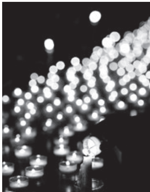
(Text und Bild: Image)

Zu seinem Gedenken wird der Blasiussegen gegen Halskrankheiten und alles Böse gesendet, der auf die Überlieferung zurückgeht, dass Blasius im Gefängnis einen Jungen vor dem Erstickungstod bewahrt hat.