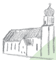
Otmar-Pfarrei www.andwil.ch/ kirche