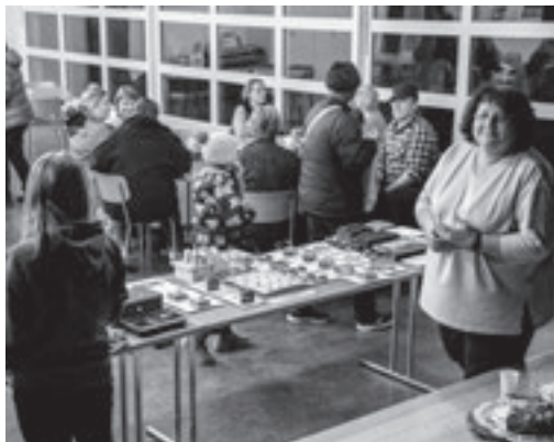
Der Adventsbasar am Mittwoch, 29. November, im Pfarreiheim war wieder ein voller Erfolg. Allen Frauen, die an der Vorbereitung und Umsetzung beteiligt waren, ein herzliches Dankeschön!