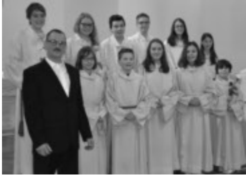
Ministrantenaufnahme vom 7. Dezember 2014